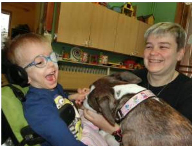
Canisterapie s Bublinou

Canisterapie probíhala skupinově. Tato podpůrná terapie založená na přímém kontaktu dítěte se psem napomáhala ke zlepšení psychosociálního vývoje dětí. Přispívala k rozvoji jemné a hrubé motoriky, zvyšovala motivaci dětí a tím podněcovala verbální i neverbální komunikaci, orientaci v prostoru, sociální interakci a emoční vývoj. U dětí jsme mohli pozorovat postupné zlepšení koncentrace pozornosti, snížení agresivity a rozvoj sociálního citění. Děti prožívaly radost a uvolnění. K počtu dětí byl vždy adekvátně zajištěn počet dospělých osob tak, aby canisterapie mohla nerušeně probíhat, aby každé dítě mělo podporu a vedení při kontaktu se psem a mohlo se maximálně zapojit do připravených aktivit.