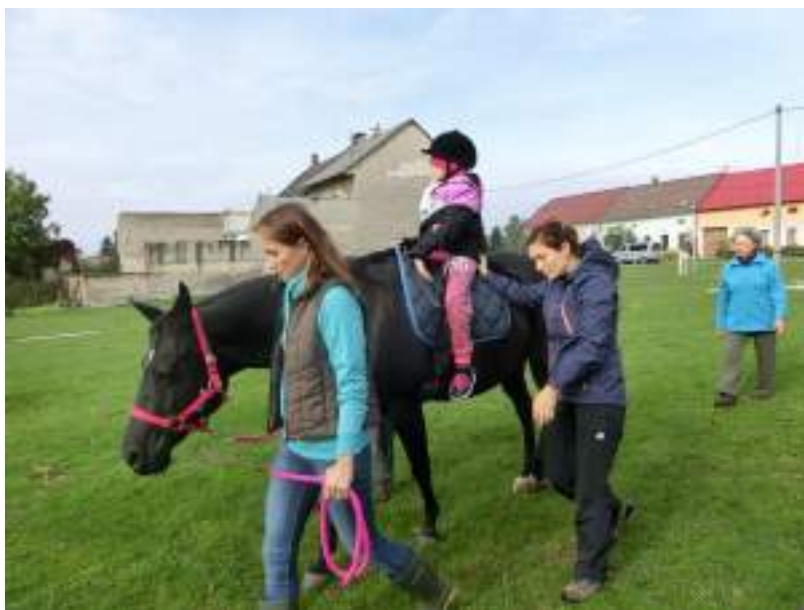
Hipoterapie v Tlumačově

Nabízí tak perspektivní, interdisciplinární problémy řešící přístup k vyšetření, léčbě dětí a managementu (optimální výběr kompenzačních pomůcek, sedaček, vertikalizačních stojanů, vhodné hračky a výběr činností ve volném čase, atd.)