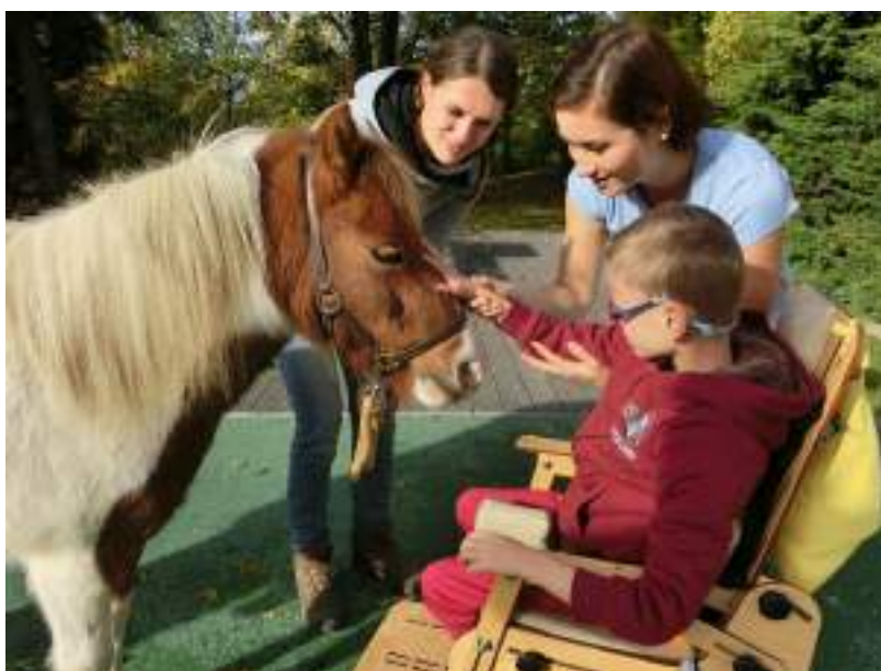
Terapie s poníkem