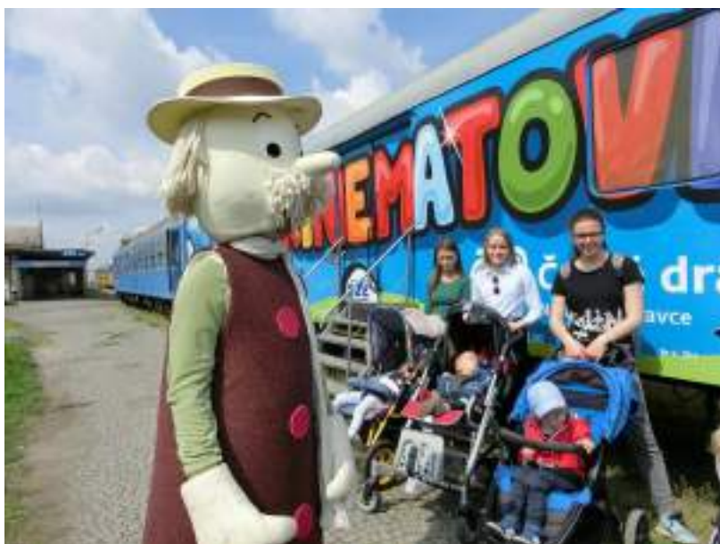
Filmový festival pro děti

Po celý květen se větší část zaměstnanců stacionáře zapojila do soutěže „Do práce na kole“ a vytvořila tým cyklistů a pěšáků Víly z vili. V červnu proběhla ve stacionáři stáž zaměstnanců z centra Auxilium, o.p.s. ze Vsetína a o týden později setkání konzultantů programu Portage. Děti měly zpestřený program hipovýletem na ranč Montana Trail v Tlumačově.