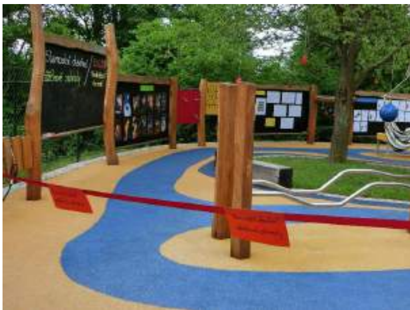
Slavnostní otevření Zážitekvé zahrady

Na konci měsíce bylo završeno dlouhodobé směřování stacionáře ke změně stravování a celkové přístupu k životnímu stylu a prostředí dětí i zaměstnanců získáním Bronzového certifikátu Skutečně zdravé školy.