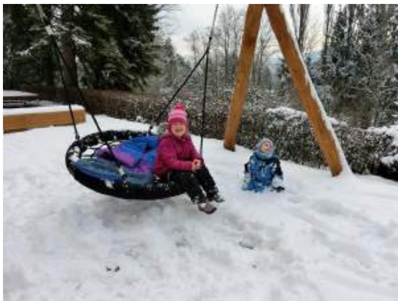
Pobyť na zahradě